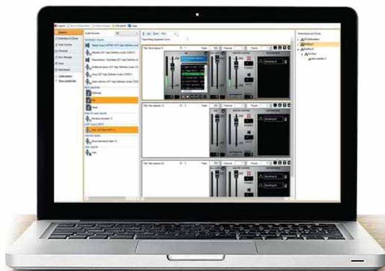
2N® NetSpeaker Control Panel