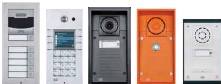
2N® Helios IP Verso