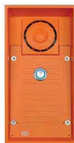
2N® Helios Safety