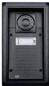
2N® Helios Force