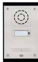
2N® Helios Uni